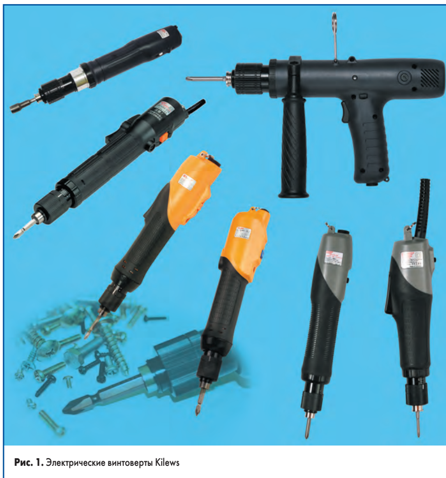
Рис. 1. Электрические винтоверты Kilews

В совокупности выпускаемые электрические винтоверты покрывают широкий диапазон установки предельного крутящего момента от 0,02 до 15 Н/м, что обеспечит затяжку соединений с диаметром метрической резьбы от 1 до 10 мм. Все винтоверты оборудованы переключателем, обеспечивающим реверс вращения.