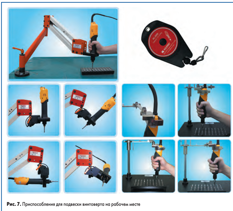
Рис. 7. Приспособления для подвески винтовёрта на рабочем месте

Крепежные изделия можно подготовить для работы и без специального устройства для автоматической подачи, используя специальные кассеты. Конусообразные отверстия позволяют при встряхивании кассеты устанавливать